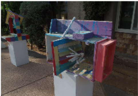
נסלי דביר והמשפחה