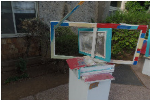
שחר זלינגר והמשפחה

בתהליך לימודי ההעשרה בסטודיו סעידי לאמנות בוצעו 7 תרגילי צורה, צבע ותנועה בהשתתפות ההורים. אפריל 2016 סטודיו סעידי