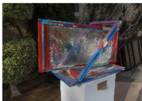
עברי אוזן והמשפחה