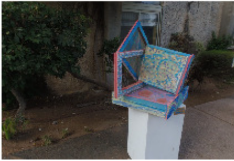
יובל בן ששון והמשפחה

בתהליך לימודי ההעשרה בסטודיו סעידי לאמנות בוצעו 7 תרגילי צורה, צבע ותנועה בהשתתפות ההורים. אפריל 2016 סטודיו סעידי