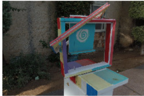
דיו בירן והמשפחה