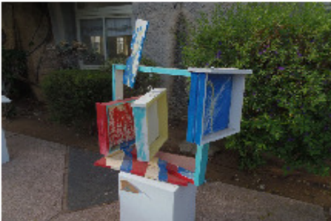
רותם זלינגר והמשפחה