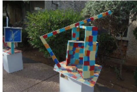
לילי סעידי והמשפחה